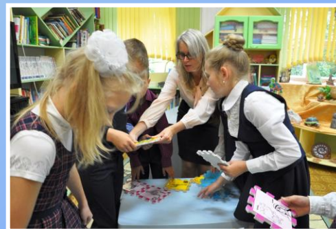
«ЧепухАтом»: игра в библиотеке