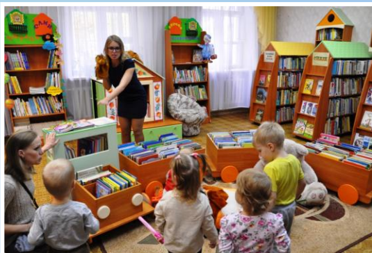
«Детское чтение для сердца и разума»