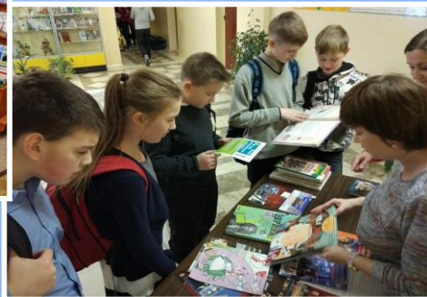
«Открывашка: ТОП – 10 изобретений»: выездная к/в в школе