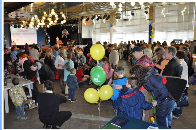
Работа творческих площадок